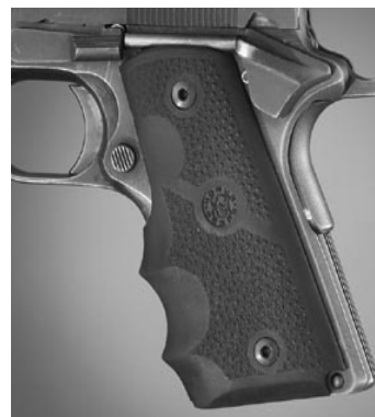
Wrap-Around Grips in gomma