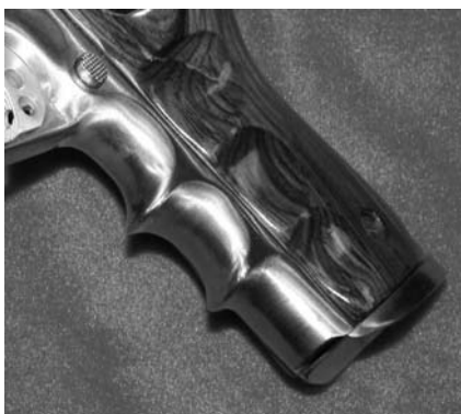
Machined Finger Grooves