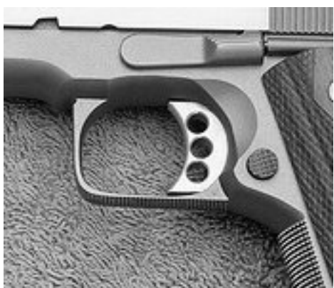
Squared trigger guards