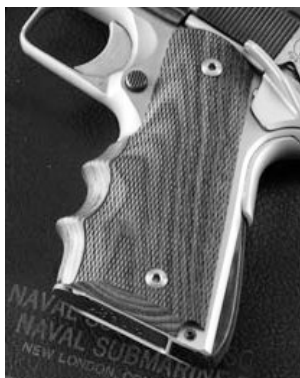
Wrap-Around Grips in legno