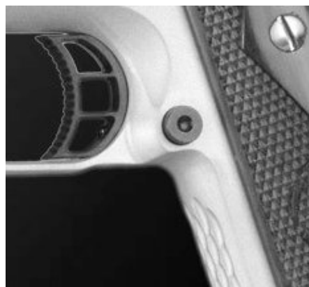
Undercut trigger guards